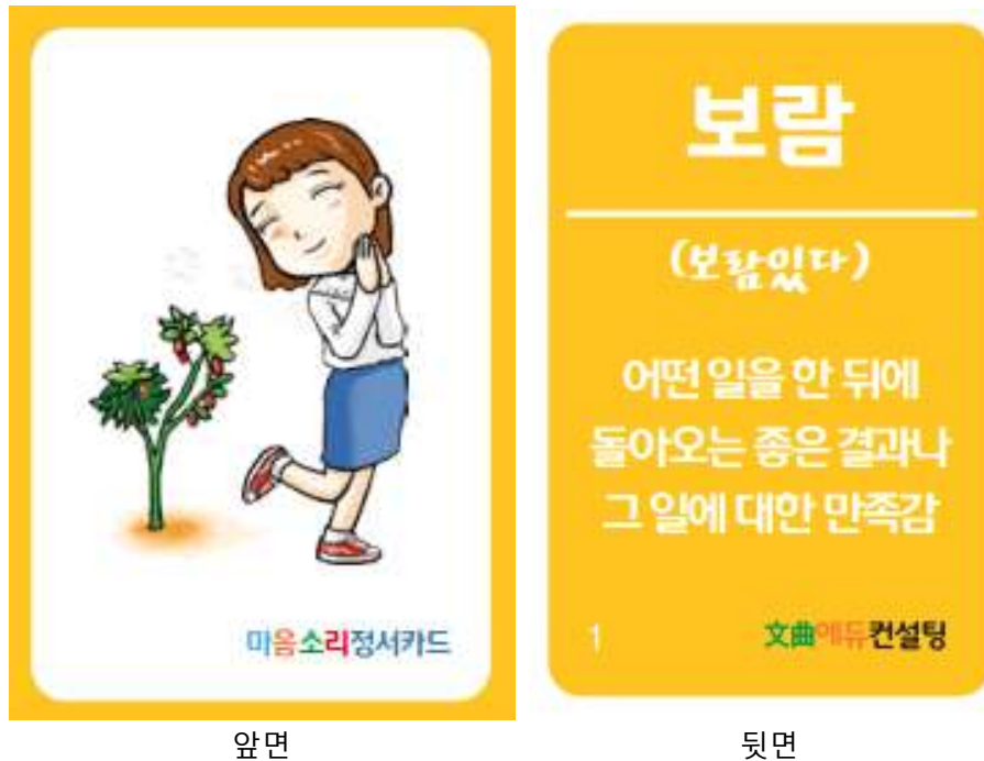
<그림-1> 마음소리 감정카드 모형(학생용)